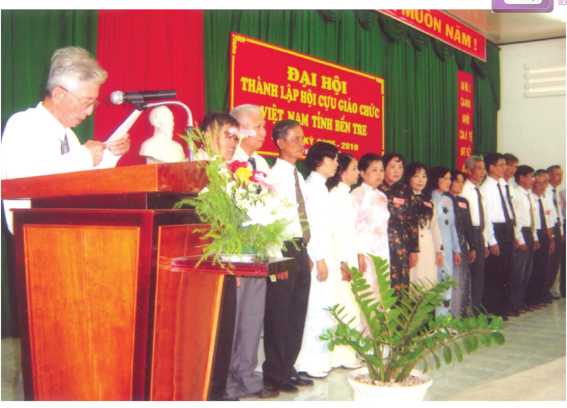
Đại hội thành lập Hội Cựu giáo chức Việt Nam tỉnh Bến Tre (ngày 28 tháng 7 năm 2005)