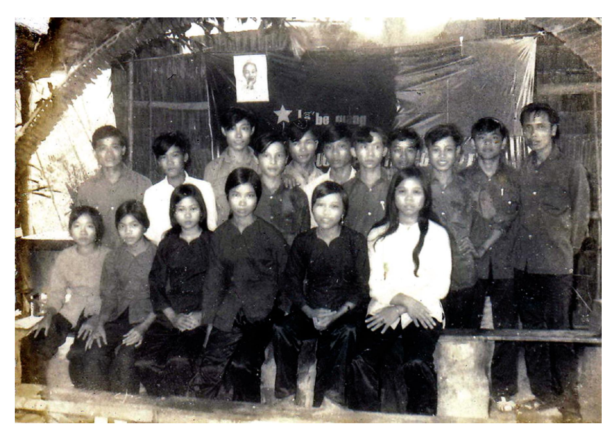
Thầy, trò lớp 6/10 phổ thông thời kỳ chống Mỹ

Kỷ Yếu Nhà Giáo Tiêu Biểu Tỉnh Bến Tre <u>345</u>