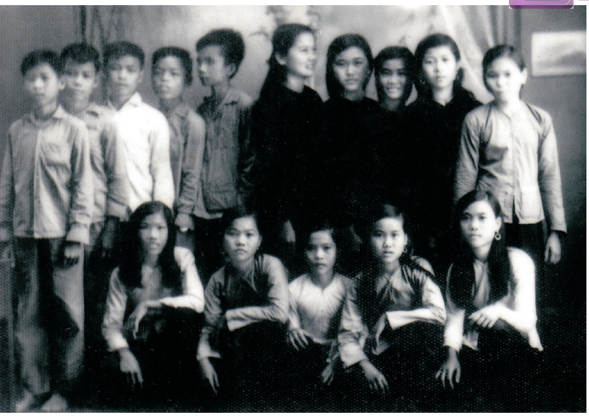
Cô, trò lớp học bổ túc văn hóa thời kỳ chống Mỹ