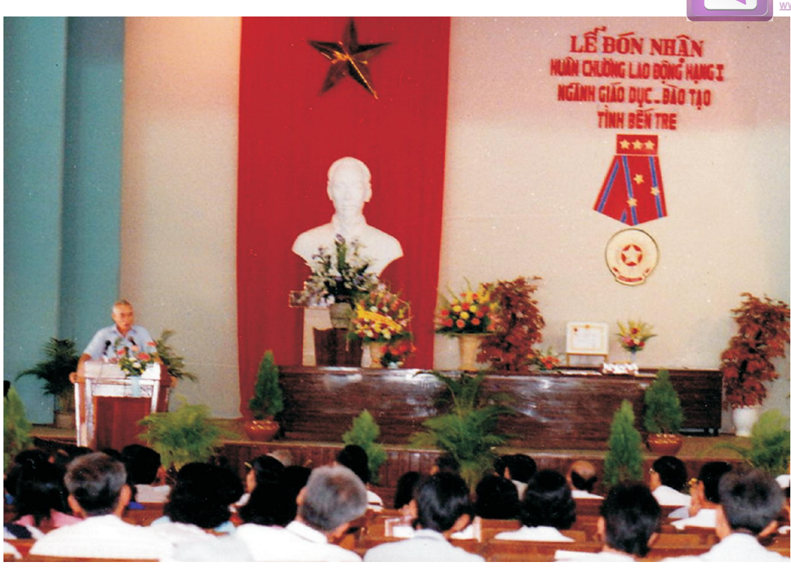
Lễ đón nhận Huân chương Lao động hạng nhất của Ngành giáo dục - đào tạo Bến Tre